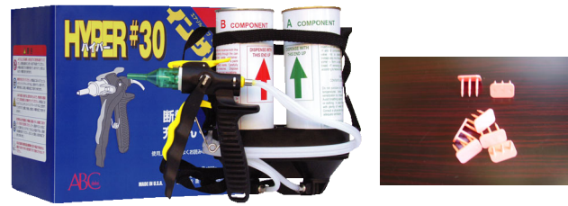
副資材；インサルパック Hyper#30 ・ 固定ピン